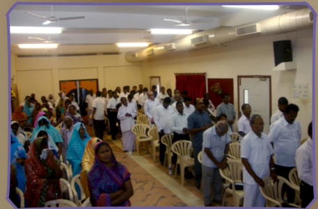
கலந்து கொண்ட போதகர் குடும்பங்கள்