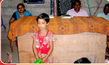
இயேசு கிறிஸ்துவை சொந்த இரட்சகராக ஏற்றுக் கொண்ட சிறுவர்கள் சாட்சி அறிவிக்கிறார்கள்