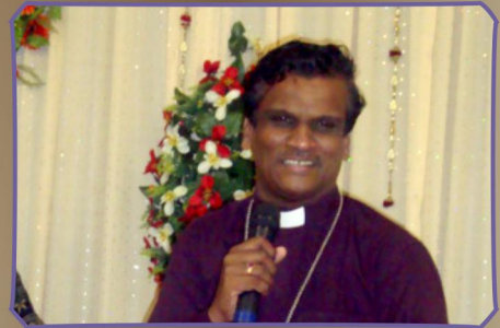
சிறப்பு செய்தியளிக்கும் பிஷப் தேவதாஸ் அவர்கள்