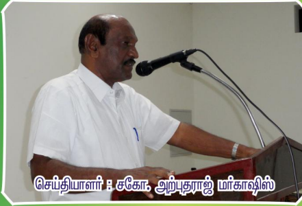
செப்தியாளர் : சகோ, அற்புதராஜ் மர்காஷிஸ்