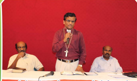
ஊழியர்களுக்கு ஆலோசனை - பிஷப் தேவதாஸ்