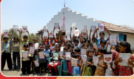
ஆலயத்தின் முன்பு CBC சிறுவர்கள்