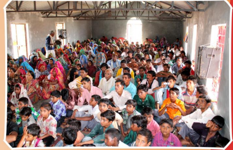
கூடியிருந்த சபை விகவாசிகள்