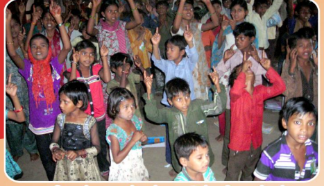
அபிநயப் பாடல்கள் பாடும் சிறுவர்கள்