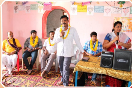
குஜராத், கங்கலோ கிராம ஆலய ஞாயிறு ஆராதனையில் செய்தி மற்றும் ஜெப வேளையில்