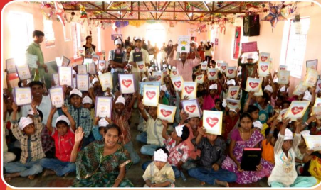
CBC பயிற்சி புத்தகங்களுடன் சிறுவர்கள்