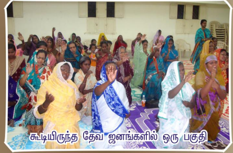
கூடியிருந்த தேவ ஜனங்களில் ஒரு பகுதி