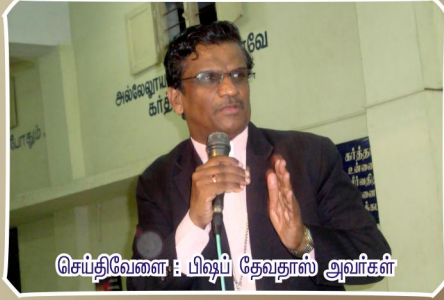
செப்திவேளை : பிஷப் தேவதாஸ் அவர்கள்