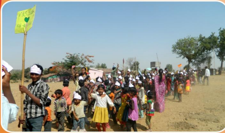
உற்சாகமாய் பாடல் பவனி செல்லும் CBC சிறுவர்கள்