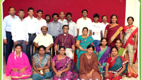
தலைமை அலுவலக மற்றும் முன்னேற்றப்பணி ஊழியர்கள்